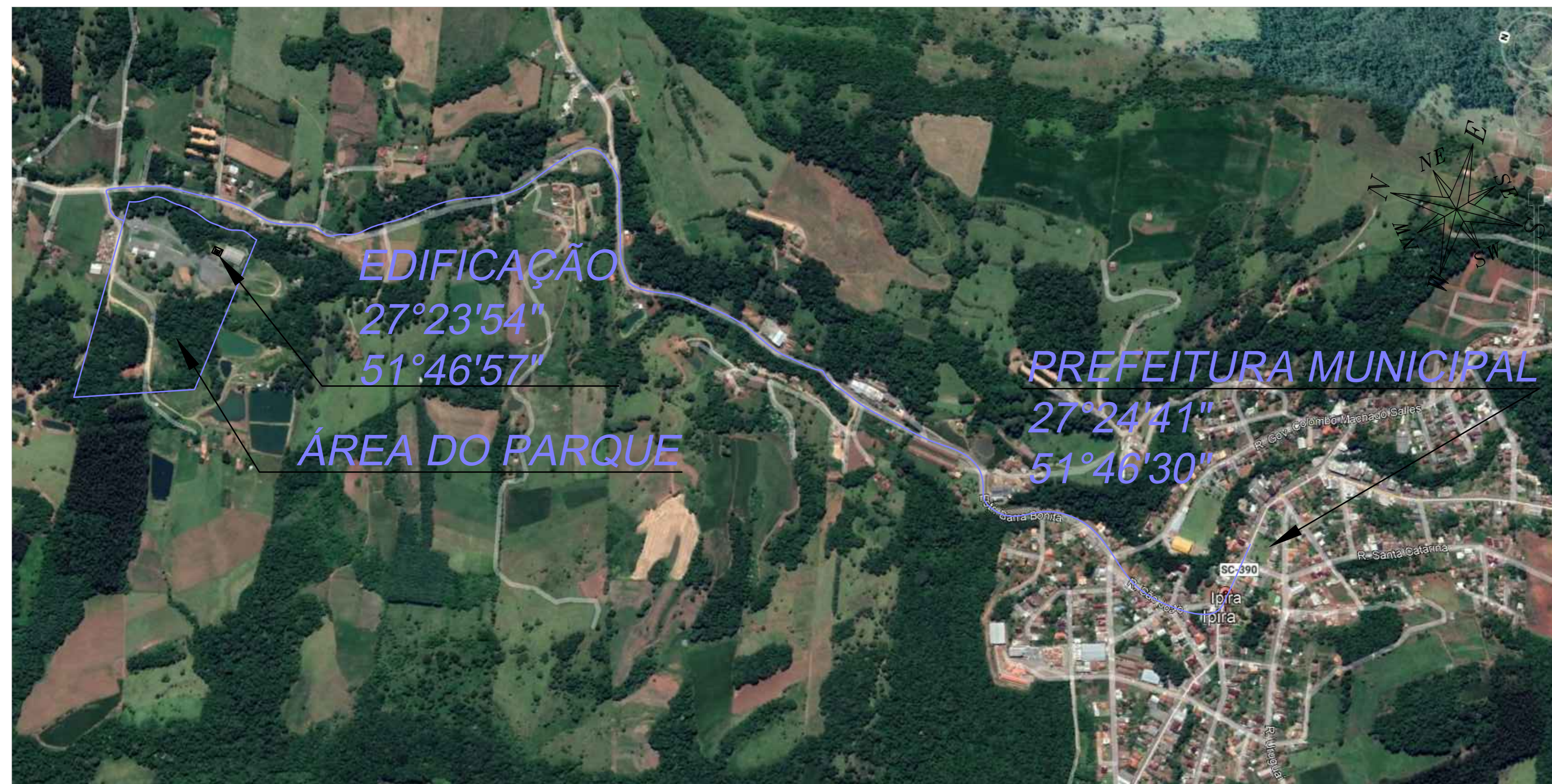
PLANTA DE LOCALIZAÇÃO