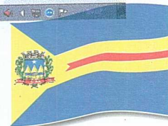
Imagem gráfica e identidade visual